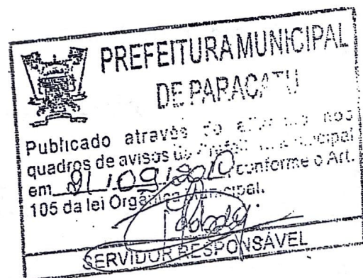
VASCO PRAÇA FILHO Prefeito Municipal

Paracatu – Minas Gerais, 21 de setembro de 2010.